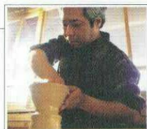
オプションメニュー 匠の技にふれる