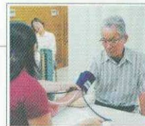
ストレスチェックなど