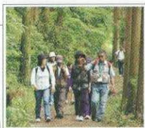
石垣の村トロッコ道コース