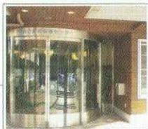
日之影町保健センター