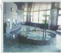
日之影温泉駅の温泉