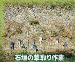
石垣の草取り作業