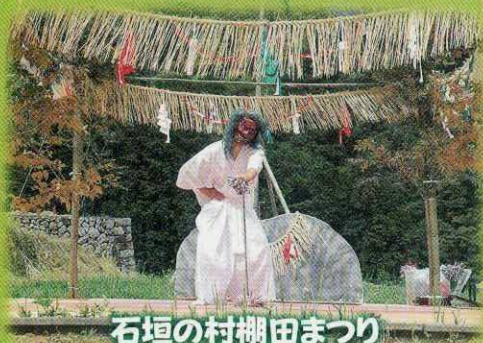
石垣の村棚田まつり

平成3年に『戸川地区石垣の村管理組合』を結成し、その保存・継承のみならず、「棚田まつり」などのおもてなしイベントの開催や日之影町の森林セラピーツアーなどを受入し、山村での交流を意識した体験メニューを提供しています。