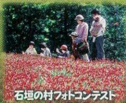
石垣の村フットコンテスト