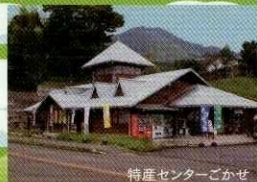
特産センターごかせ