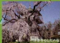
浄専寺のしだれ桜